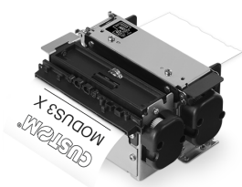
915LF020300300 STAMPANTE MODUS3 X USB RS232 CON PRESENTER

Via I. Newton, 4 - 43010 Fontevivo PR - P. IVA: IT02498250345 - TEL: +39 0521 680111 - FAX: - CODICE UNIVOCO: 8RQN7AZ