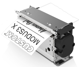
915LF020200300 STAMPANTE MODUS3 X USB RS232 COMPATTA