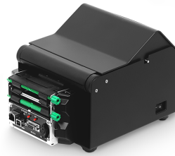
911LU010200733 PRINTER TK862 ETH USB RS232 DF