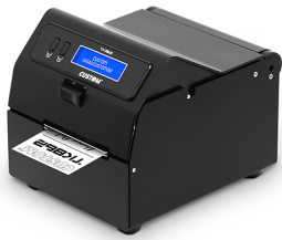
911LU010100733 PRINTER TK862 ETH USB RS232