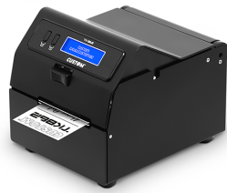
911LU010300733 PRINTER TK862 ETH USB RS232 EJECTOR