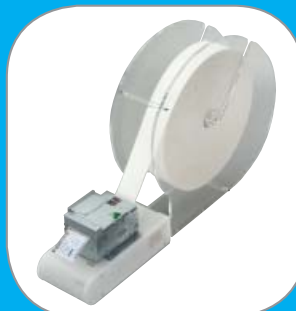
Ampio rotolo di carta