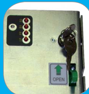
Chiavetta di sicurezza